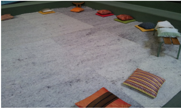
Festival d'Ozon, à Séné (56)