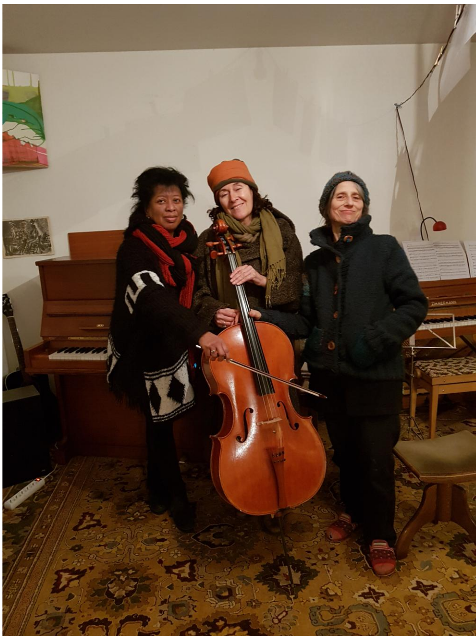
LES VIOLONCELANES AUX QUATRE VENTS à Séné le 25 Février 2018